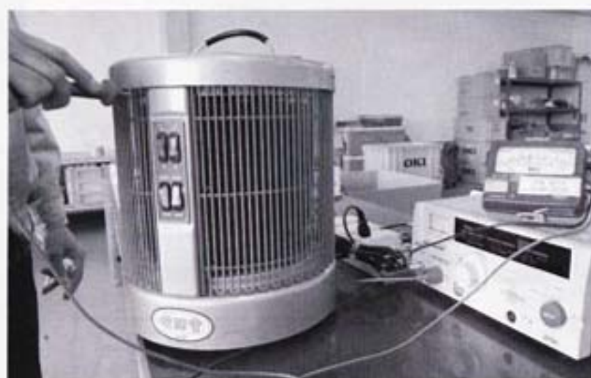
▲組み立てが終わった製品の通電チェック