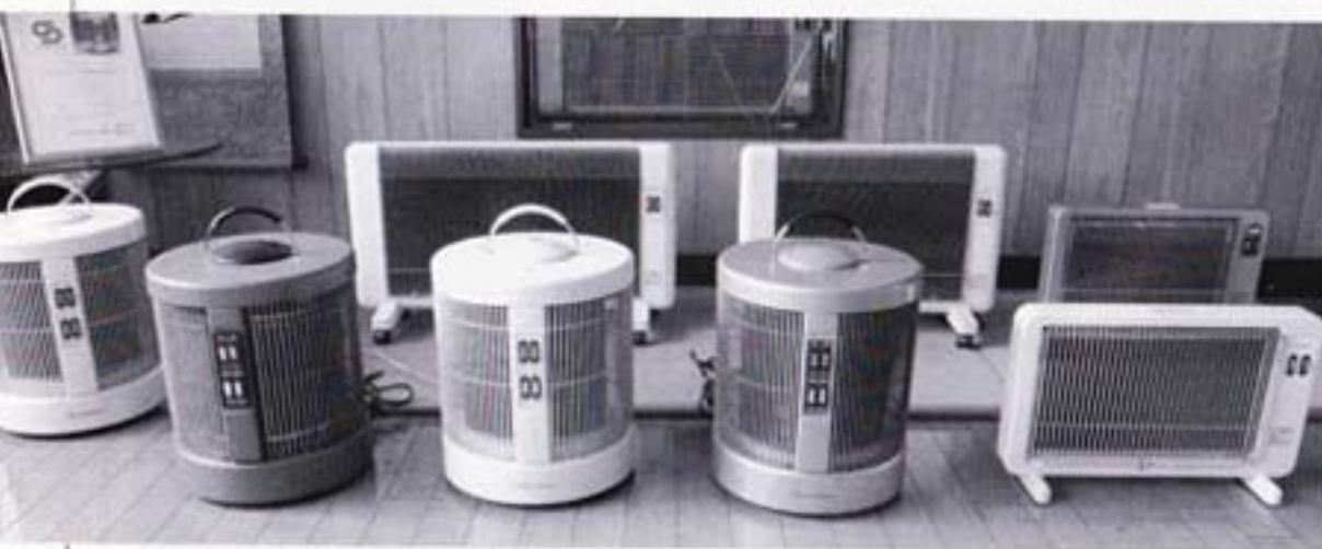
◀フラット型「夢暖望」と丸型「暖話室」の完成品